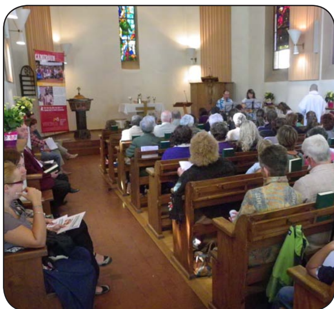
Culte d'envoi du 19 juin Lorsque Martigny entre en communion avec Bafoussam !