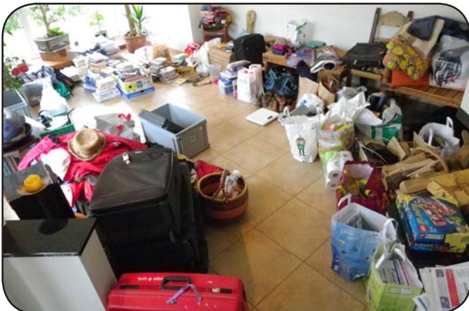
Prochaine étape: peser et emballer